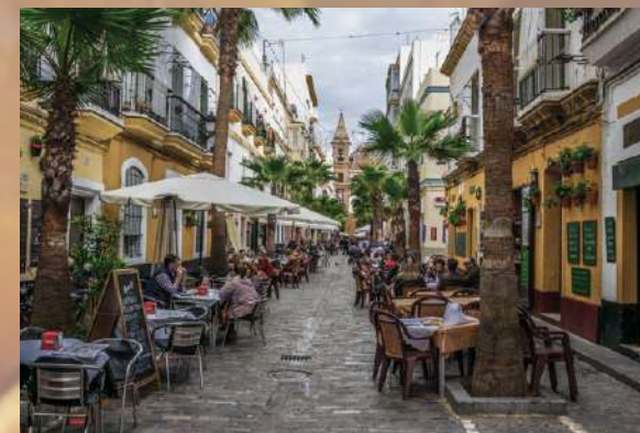
CALLE DE LA PALMA