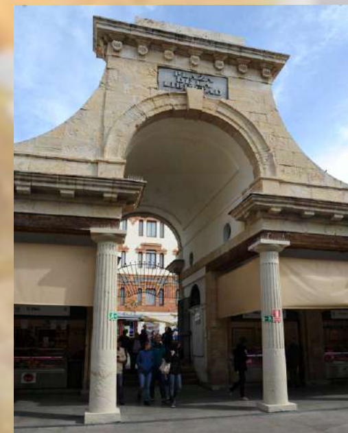
ZONA MERCADO DE ABASTOS

Cádiz dispone de una amplia y variada oferta gastronómica. Muchos son los lugares que podemos visitar y disfrutar en ellos de sus platos típicamente gaditanos. Aquí os dejamos algunas sugerencias de sitios y zonas recomendadas. No obstante, debemos ser previsores y reservar con anterioridad para evitar contratiempos.