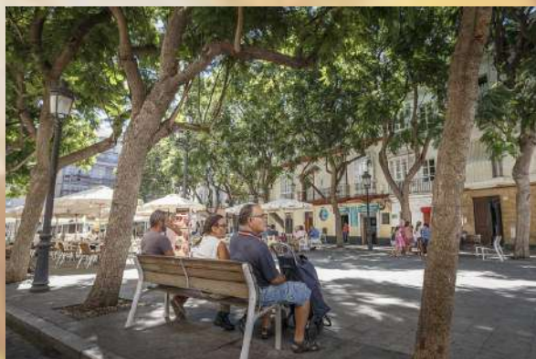
PLAZA DEL MENTIDERO